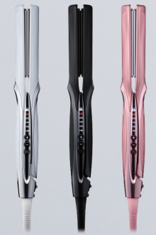
ホワイト ブラック ピンク