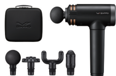
Power Gun Plus